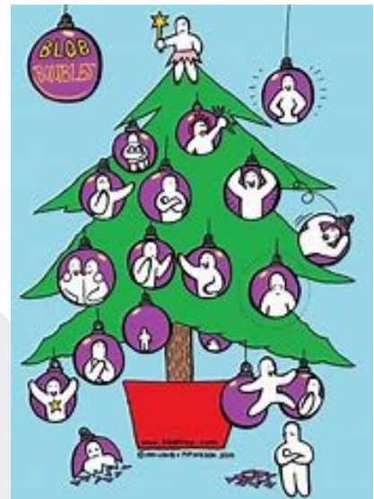
Enkele voorbeelden van blobtree afbeeldingen.