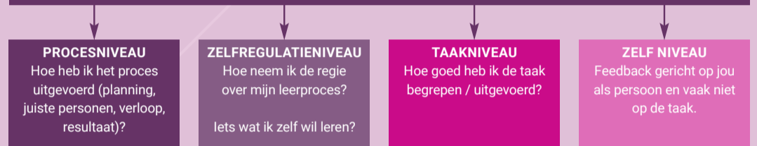
Effectieve feedbackmodel (Hattie & Timperley, 2007)