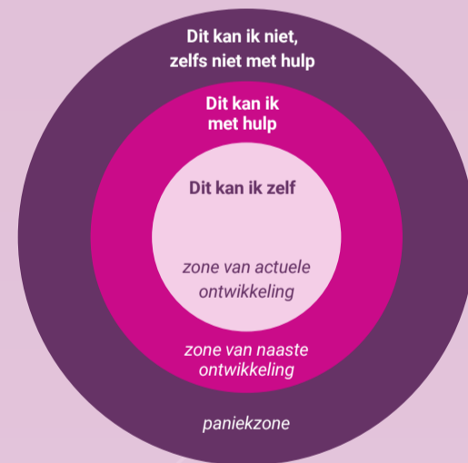
Zones van ontwikkeling (Vygotsky, 1994)

Als je feedback vraagt om bijvoorbeeld jouw leeruitkomsten aan te (gaan) tonen, zorg er dan zoveel mogelijk voor dat de antwoorden je helpen om in de zone van naaste ontwikkeling of actuele ontwikkeling te komen en vooral niet in de paniekzone .