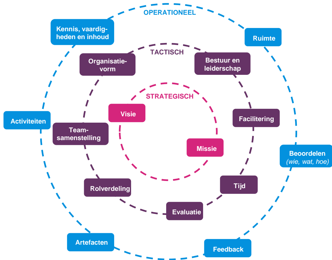
Figuur 2: Spinnenweb als leidraad voor de verticale as van het ontwikkelinstrument