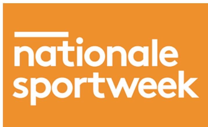
Nationale sportweek 2021 Sport bereikbaar maken voor iedereen.