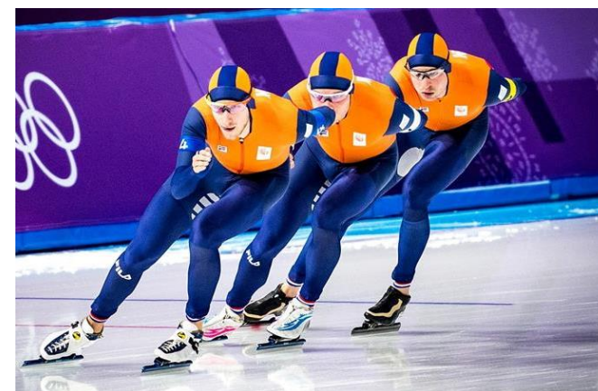
EK langebaanschaatsen 2022