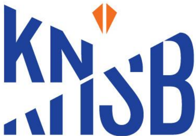
Koninklijke Nederlandse schaatsbond