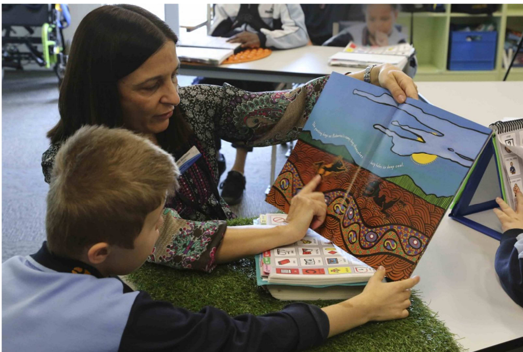
Interactief voorlezen met grafische symbolen