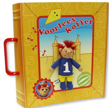
De voorleeskoffer van het Zandkasteel

Maak het verhaal aantrekkelijk en levendig voor uw kind door gebruik te maken van voorwerpen die ook in het boek voorkomen. Bij boeken over dieren kunt u bijvoorbeeld verschillende knuffelbeesten mee laten spelen met het verhaal. Er bestaan ook voorleeskoffers met daarin boeken en bijbehorende materialen, bijvoorbeeld de voorleeskoffer van het Zandkasteel (zoek via www.google.nl op 'voorleeskoffer' en 'Zandkasteel'). Gebruik de materialen tijdens het voorlezen om het verhaal en de woorden te verduidelijken of speel na afloop van het voorlezen samen het verhaal na aan de hand van de materialen.