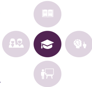
Figuur 2) De centrale pijler in de plus

Op een systematische en transparante manier het handelen in beeld brengen, kunnen verantwoorden én veranderen.