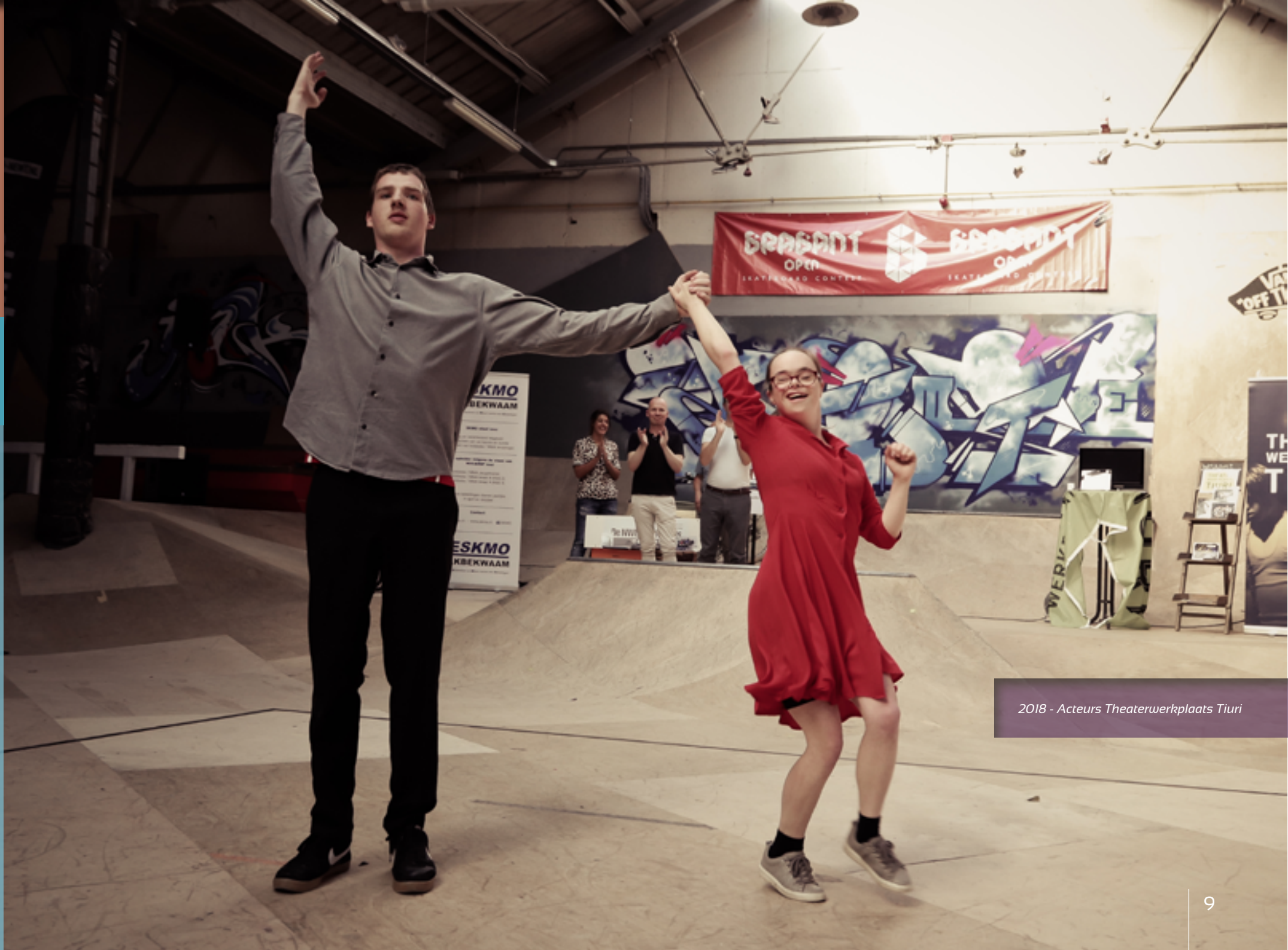
2018 - Acteurs Theaterwerkplaats Tiuri