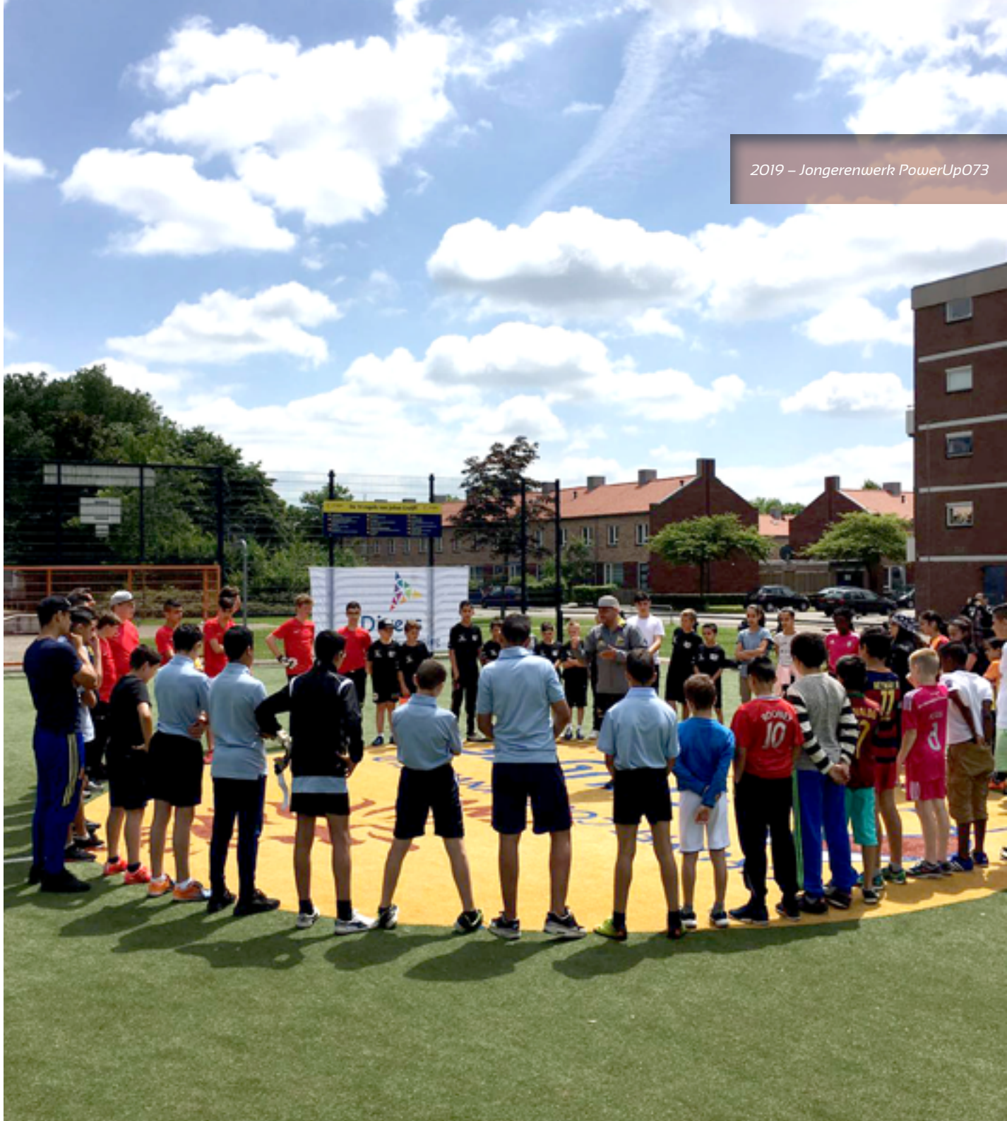
2019 – Jongerenwerk PowerUp073