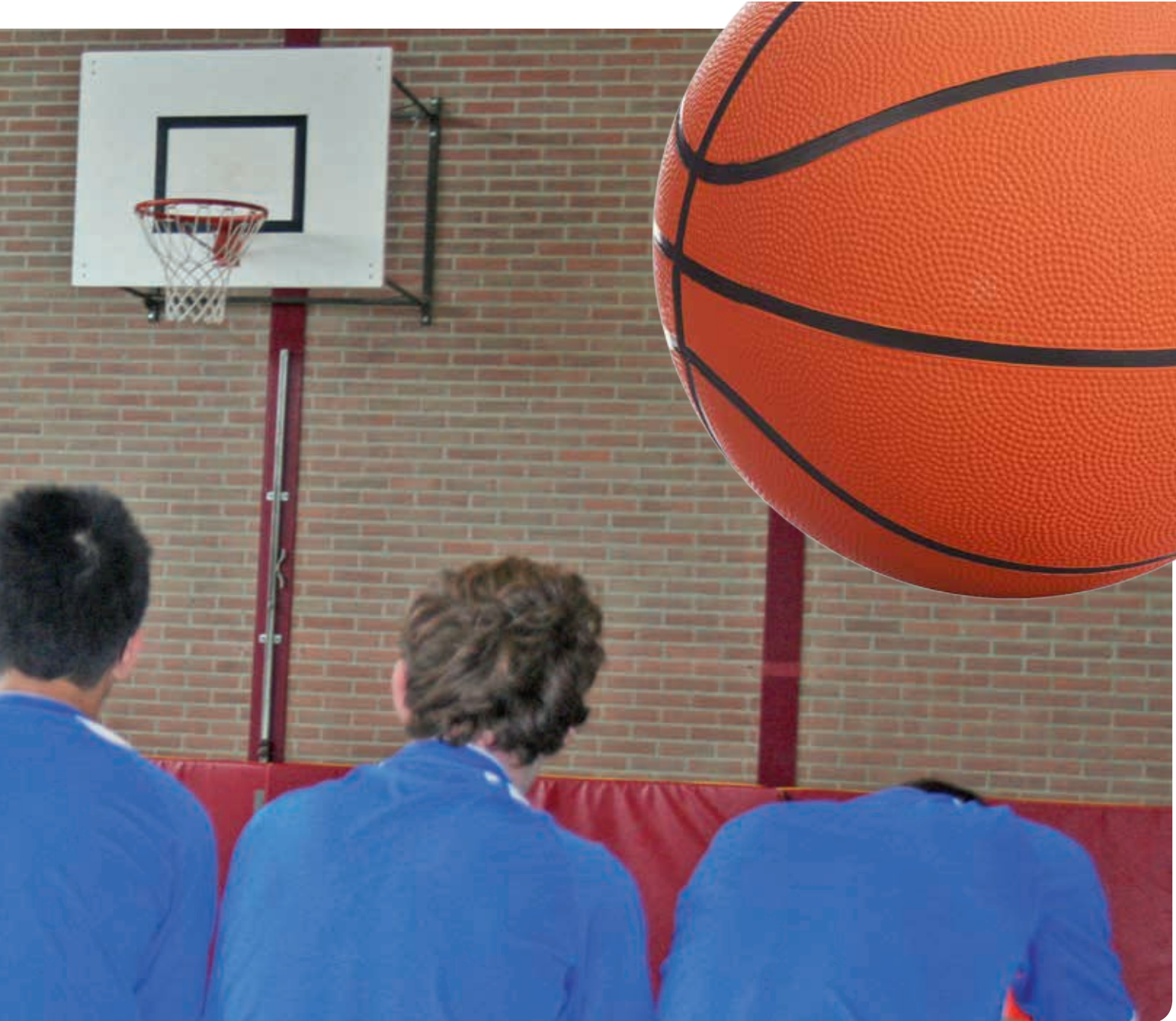
▼ Help ik krijg vandaag een cijfer Figuur 1. Verschillen tussen een les met en zonder cijfer. Bijvoorbeeld voor competentie: hoe groter de letters, hoe meer gevoelens competentie.