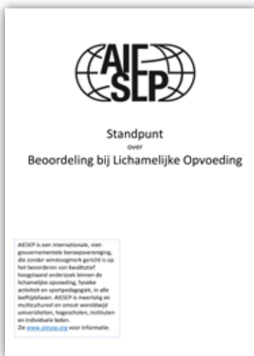
▲ Advies AIESEP over beoordelen

Bij die beoordelingsvormen speelt technologie steeds vaker een rol. Denk aan het gebruik van video-feedback, apps of een digitaal portfolio. Mits op een juiste manier ingezet, kunnen