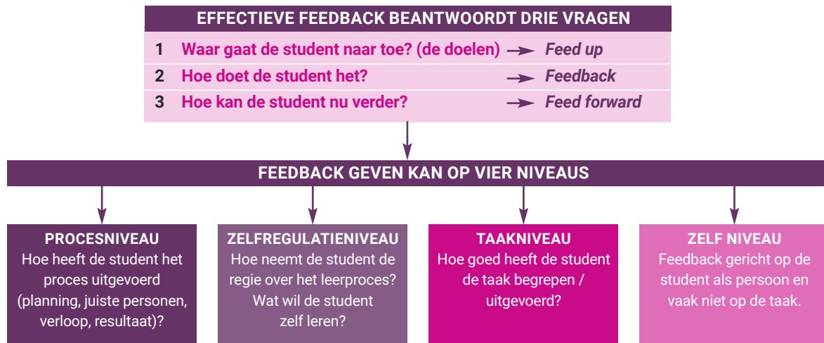
Figuur 2 Effectieve feedbackmodel (Hattie & Timperley, 2007), aangepast door Mieke Jaspers en Fieke Tychon (2022)

Alle drie de (feedback-)vragen kunnen op vier verschillende niveaus gesteld worden, waarbij met name feedback vragen op proces- en zelfregulativeniveau tot leren van de student leidt, met als goede derde optie feedback op taakniveau. Feedback op zelfniveau leidt vrijwel nooit tot verbetering van de leerresultaten van de student en draagt niet bij aan de persoonlijke professionele ontwikkeling (zie figuur 2).