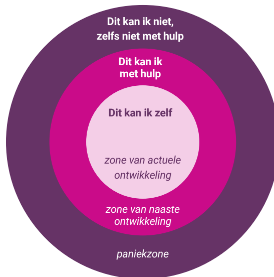
Figuur 3 Zones van ontwikkeling (Vygotsky, 1994)

Het is belangrijk om studenten te leren gerichte feedback vragen te stellen, zodat de antwoorden de student helpen om in de zone van naaste ontwikkeling of actuele ontwikkeling te komen (figuur 3). Op deze manier draagt de feedback bij aan de persoonlijke professionele ontwikkeling. In paniek raken helpt niet om tot ontwikkeling te komen. Is dit wel het geval, vraag dan aan de student waar het paniekgevoel vandaan komt en wat deze kan doen of nodig heeft om uit de paniekzone te komen.