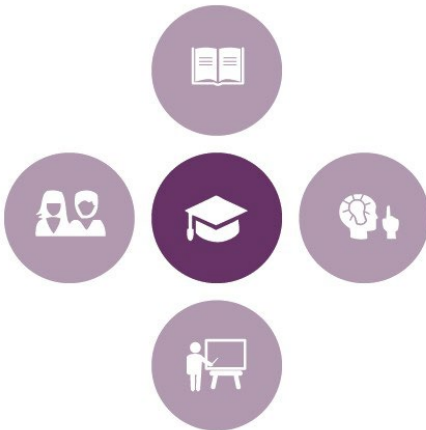
Figuur 2) De centrale pijler in de plus