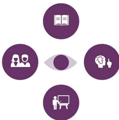
Figuur 1) De Pijlers en de Plus

Wat maakt een leraar tot een goede leraar? Bij FLOT beschouwen we vijf pijlers als cruciale factoren voor goed leraarschap.